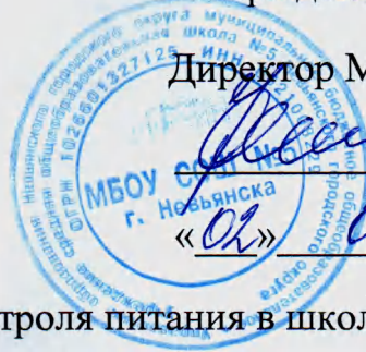
График еженедельного контроля питания в школьной столовой